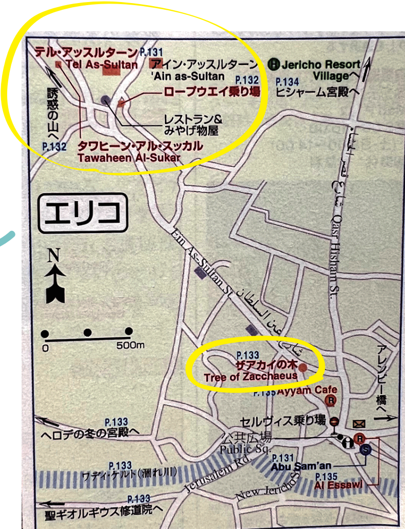
エリコでの訪問箇所