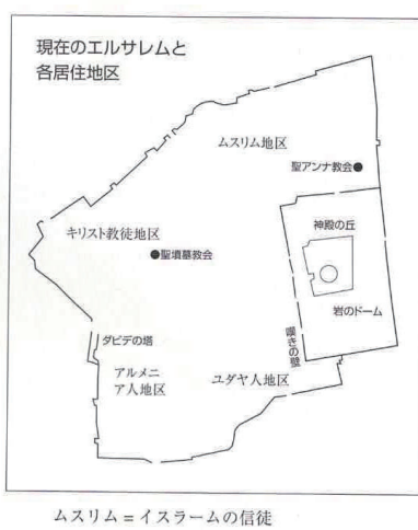
ムスリム = イスラームの信徒