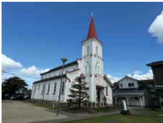
カトリック鶴岡教会